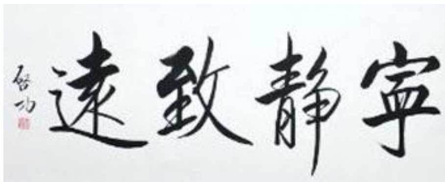
02 宁静致远，行书，138*69CM，2005 年 6 月，纸本