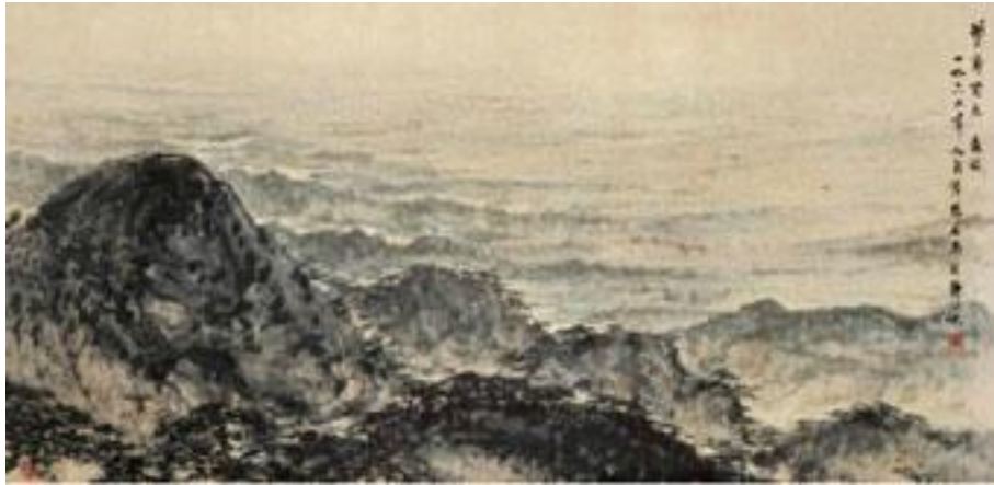
01 江山如此多娇，国画山水，138*69CM，2002年8月，纸本