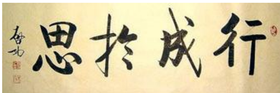
03 行成于思，行书，138*69CM，2002 年 10 月，纸本