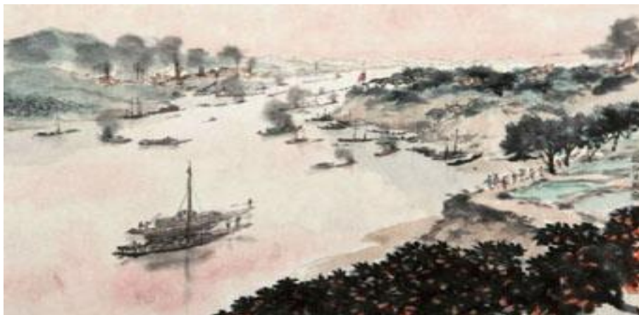
03 芙蓉国里尽朝晖，国画山水，138*69CM，1959年2月，纸本