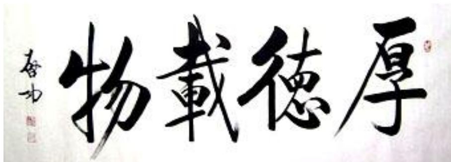
01 厚德载物，行书，138*69CM，2006 年 5 月，纸本