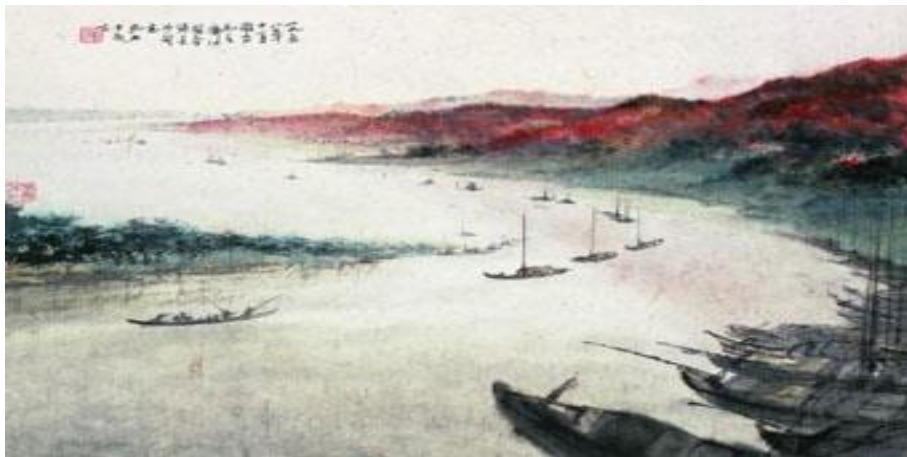
02 《沁园春·长沙》词意图，国画山水，138*69CM，1958年11月，纸本